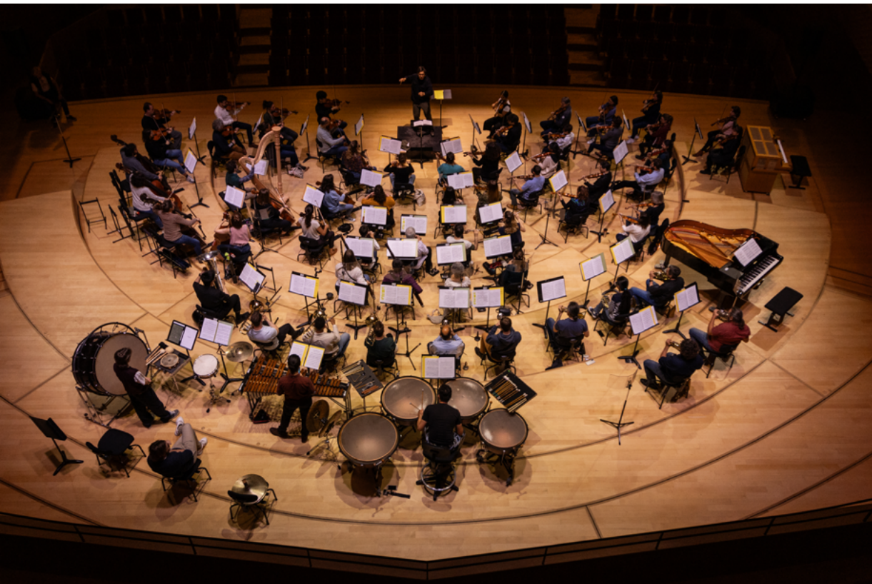
Orchestre Lamoureux La Seine Musicale 15 juin 2024

Les actions à destination du jeune public et des familles sont depuis plusieurs années au cœur même de l'activité de l'Orchestre Lamoureux. À travers un partenariat fidèle avec le dispositif Orchestre à l'École, des dizaines de jeunes musiciens partagent chaque saison la scène avec les professionnels lors de concerts symphoniques et de projets dédiés.