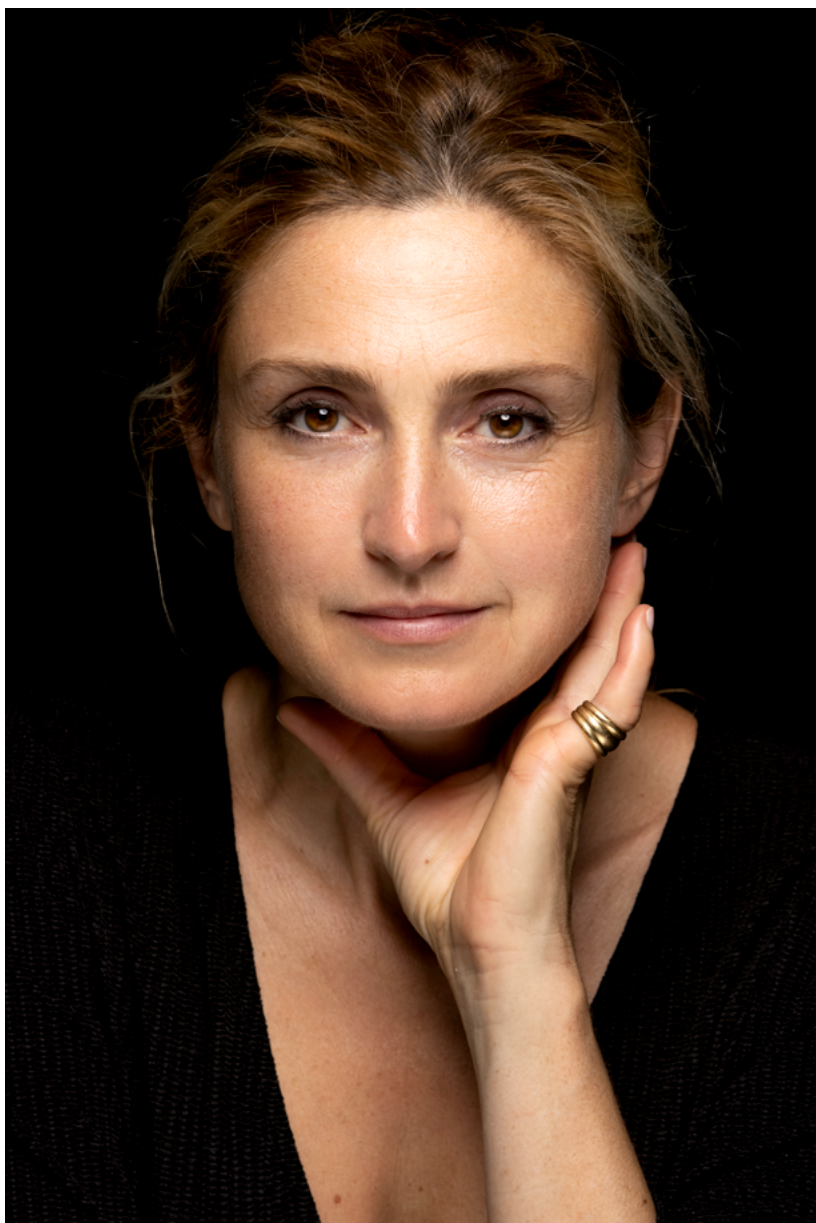
Julie Gayet