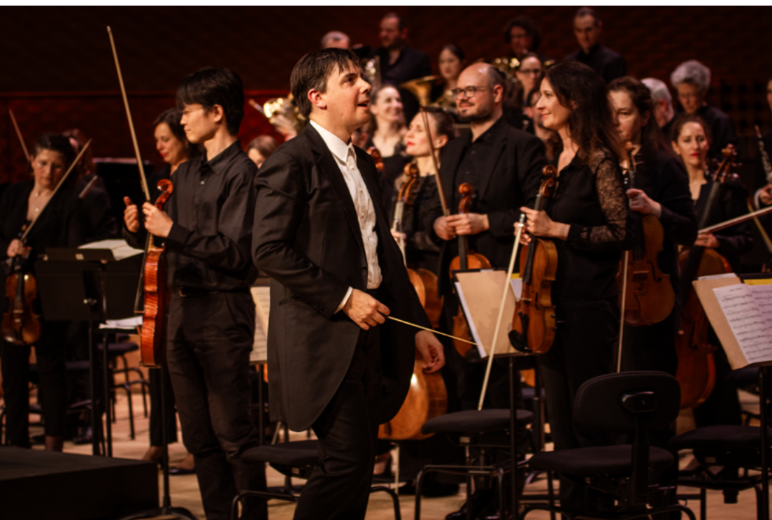
Adrien Perruchon w/ Orchestre Lamoureux La Seine Musicale 15 juin 2024

Né en 1983, Adrien Perruchon a commencé sa formation musicale au piano avant de se tourner vers le basson et les percussions plus tard dans sa carrière. Nommé timbalier principal de l'Orchestre Philharmonique de Radio France par Myung-Whun Chung en 2003, puis de l'Orchestre Philharmonique de Séoul, il occupe ces deux postes jusqu'en 2016. Au cours des saisons 2015/16 et 2016/17, Perruchon a occupé le poste de Dudamel Conducting Fellow à l'Orchestre philharmonique de Los Angeles.